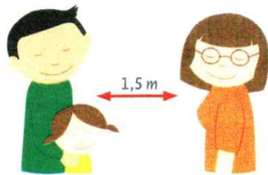
Mit einem Lächeln grüßen und Abstand halten

Folgende Bilder werden in den entsprechenden Räumen für alle Kinder deutlich sichtbar aufgehängt: