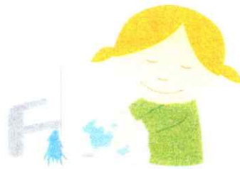
Richtig Hände waschen