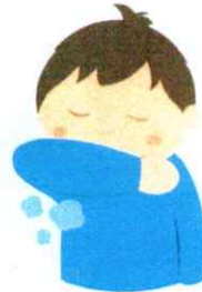
Richtig husten und niesen